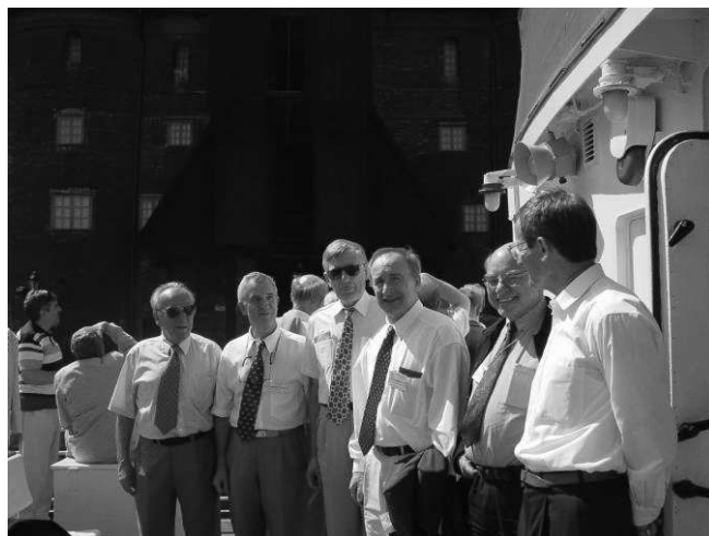
SME 2003: Rejs statkiem RUBIN z Gdańska do Juraty