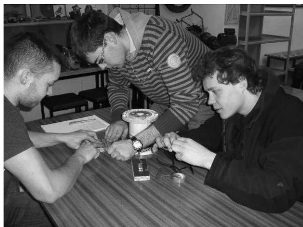
Politechnika Gdańska: Lab. maszyn elektrycznych, budowa prymitywnej maszyny elektrycznej (01.03.2011), kierunek Energetyka, sem.4