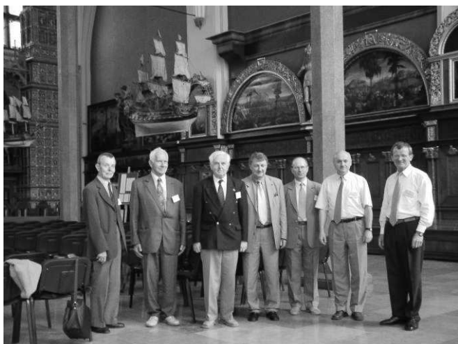
SME 2003: Dwór Artusa w Gdańsku

2015 Wice-przewodniczący Komitetu Organizacyjnego LI Międzynarodowego Sympozjum Maszyn Elektrycznych SME'2015 Gdańsk - Chmielno. Patronat: Komitet Elektrotechniki PAN – Sekcja Maszyn Elektrycznych i Transformatorów, PTETiS Oddz. Gdańsk, Prezes SEP, Polska Sekcja IEEE.