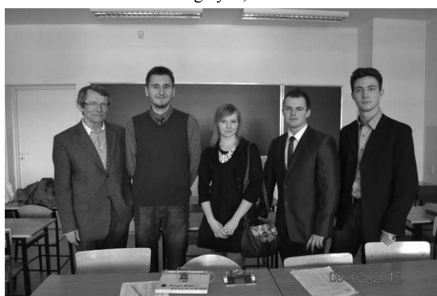
Politechnika Gdańska: Maszyny elektryczne, egzamin (09.02.2015), kierunek Elektrotechnika, sem.3