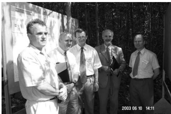
SME 2003: Jurata. Sesja plakatowa