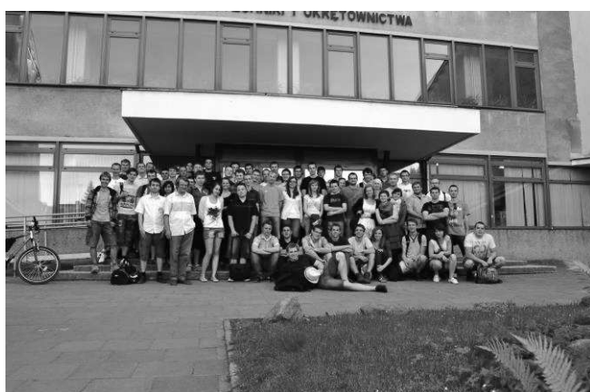
Politechnika Gdańska: Maszyny elektryczne, ostatni wykład (02.06.2011), kierunek Energetyka, sem.4