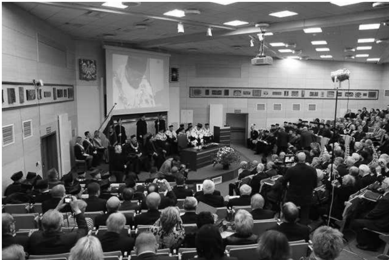
Widok auli Politechniki Świętokrzyskiej podczas uroczystości